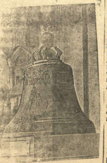
Москва. Кремль. Царь-колокол.

ложений подал заместитель начальника цеха тов. Луговских. Два его предложения внедрены в производство. Оба предложения значительно сократили простои оборудования.