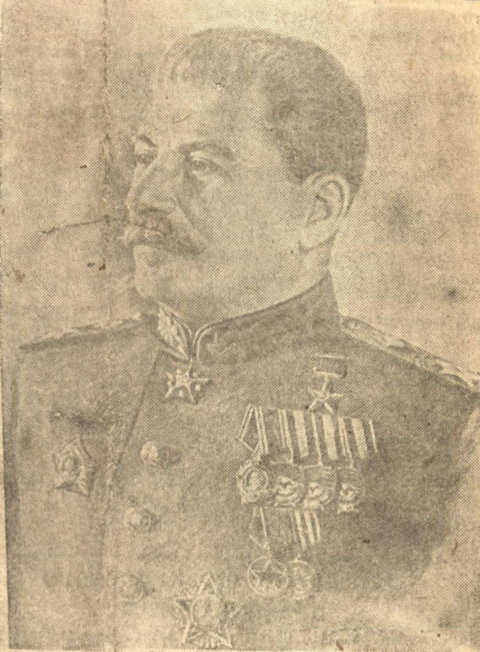
Верховный Главнокомандующий Маршал Советского Союза Иосиф Виссарионович СТАЛИН.