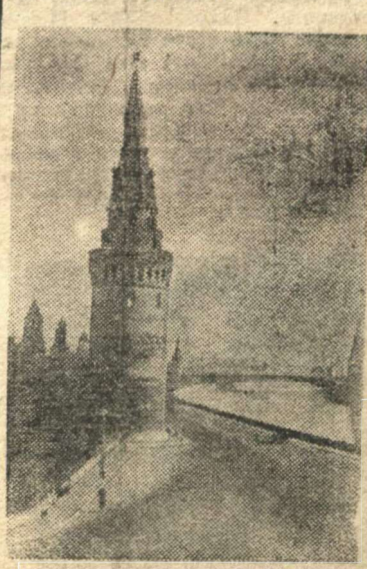
Кремлевская башня на набережной Москва-реки.