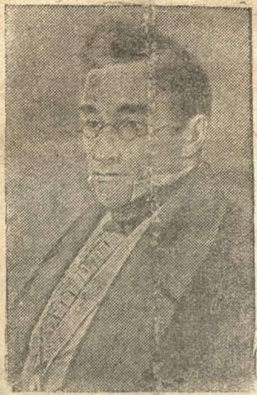
Александр Сергеевич Грибоедов, знаменитый писатель, автор комедии "Горе от ума".

В 1816 году после полного завершения войны в Наполеонном