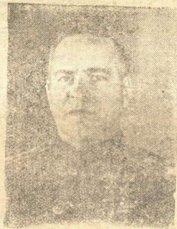
Маршал Советского Союза Г. К. Жуков Воспитала достойного сына

Председатель завкома шиморского судоремонтного завода С. КАБАНОВ.