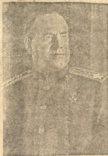
Маршал Советского Союза Г. К. ЖУКОВ

Красная Армия одержала новые крупные победы. Войска 1-го Белорусского и 1-го Украинского фронтов, перейдя в наступления с плацдармов на западном берегу Одера и на реке Нейсе, прорвали сильно укрепленные глубоко эшелонированные обороны немцев, прикрывавшие Берлин с востока и юга и ворвались в столицу Германии Берлин.