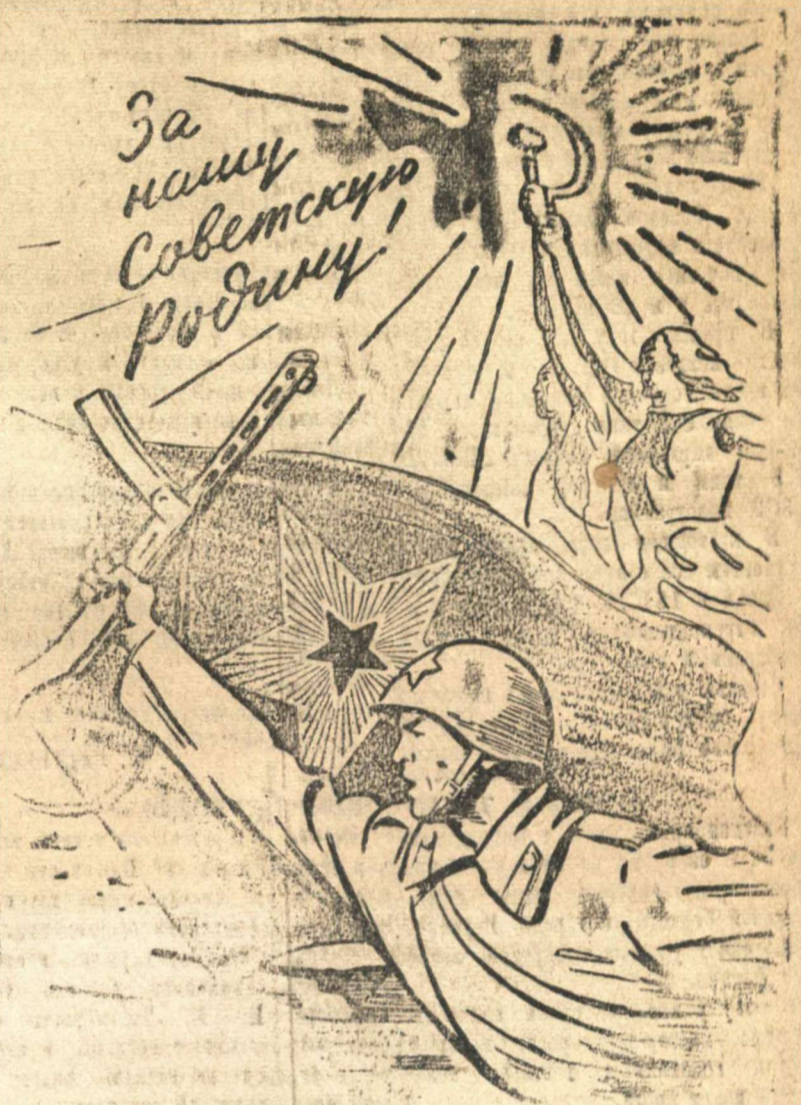
Рисунок художника Н. Аввакумова.

Городские пекари Н. Н. Шапки, награжденные тремя орденами. В одном из боев он был ранен, но не оставил командного пункта и руководил операцией до тех пор, пока она не была успешно завершена.