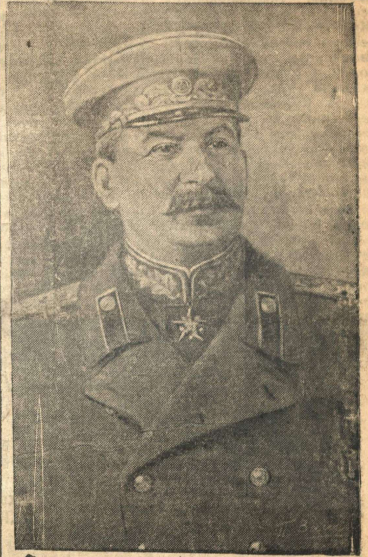
Верховный Главнокомандующий Маршал Советского Союза И. В. СТАЛИН.

От имени Советского Правительства и нашей большевистской партии приветствую и поздрав