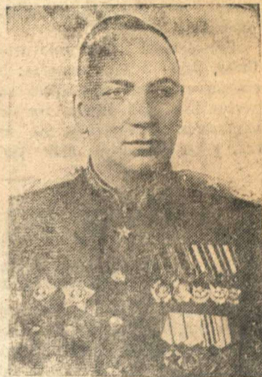
Главный Маршал артиллерии Николай Никол. ВОРОНОВ.