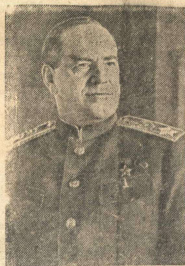
Маршал Советского Союза Г. К. ЖУКОВ.

(Из призывов ЦК ВКП(б) к 1 Мая 1945 года).