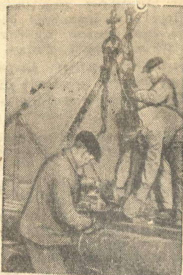
Погрузка труб для нефтепромыслов "Второго Баку".