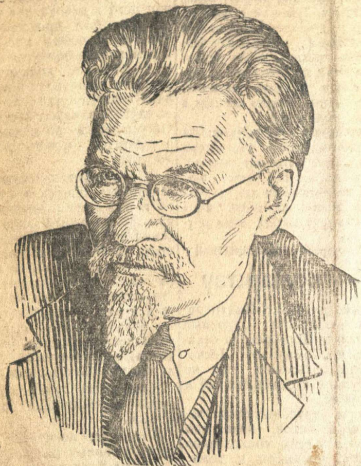
Верному соратнику Ленина и Сталина Михаилу Ивановичу Калинину

Дорогой Михаил Иванович! Центральный Комитет Всесоюзной Коммунистической партии (большевиков) и Совет Народных Комиссаров Союза ССР сердечно приветствуют Вас в день Вашего семидесятилетия.