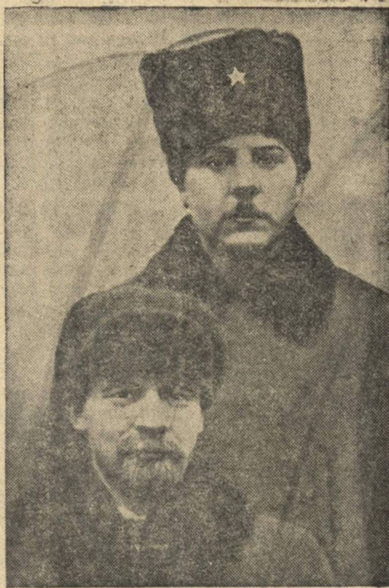
В. И. Ленин и К. Е. Ворошилов (1921 г.).

Ленин учил нас не только культуре труда и строительства, но и культуре в быту. Культурность — это чистоплотность на производстве и дома. Ленин мечтал об электрической лампочке в каждой крестьянской избе. Эта мечта осуществляется в очень широких размерах. «Лампочка Ильича» должна освещать не грязь и бескультурье, а чистые, опрятные квартиры. Строить новый быт, новую культуру по Ильичу — значит жить и трудиться, используя науку, знания так, чтобы приносить наибольшую пользу родине и людям.