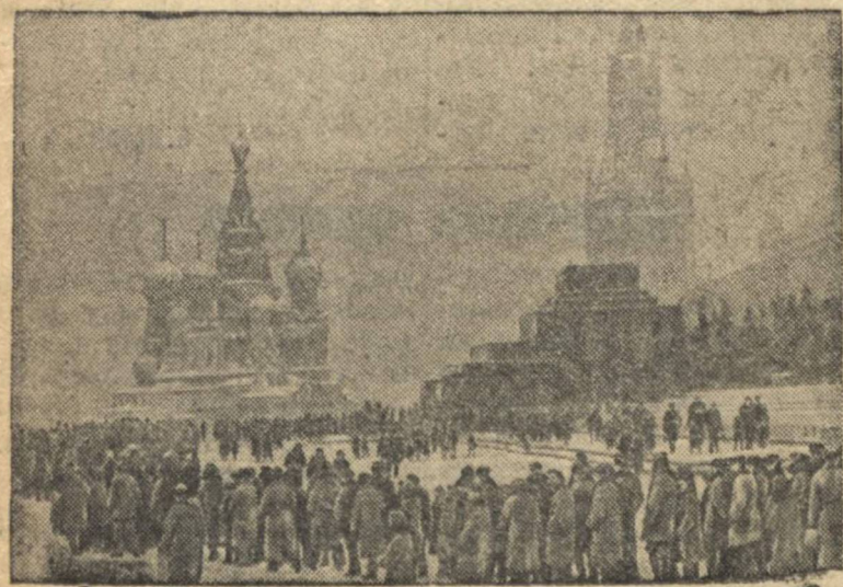
Трудящиеся у мавзолея Ленина.