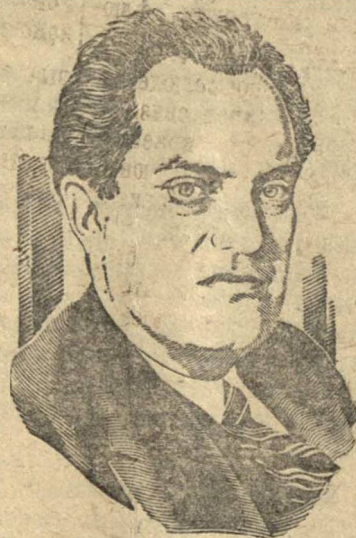
В. В. Куйбышев. Рис. К. Тендеровича

На днях в колхозе полностью (по плану) закончено комплектование пятой фермы (птицеводческой). По овцеводческой и по коню планы перевыполнены. Завхоз Чуфаровского к-за А. Евдокимов.