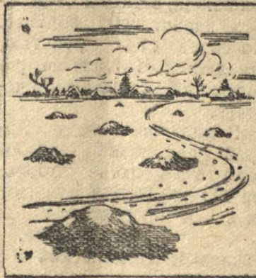
Как не надо складывать навоз в поле.