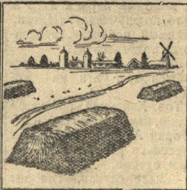
Как правильно складывать навоз.

Начальник отдела удобрений Наркомзема СССР.