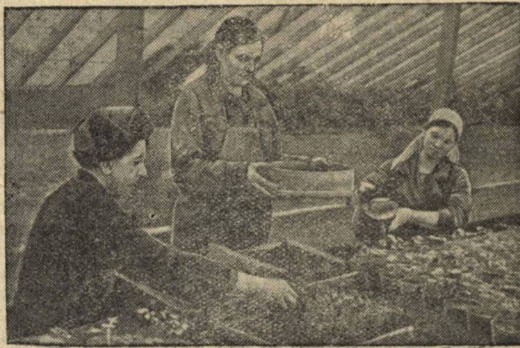
Пикировка томатов для высадки в парники.

Колхоз «Заветы Ильича» (Красногорский район Московская область) за успешную работу в 1940 году получил районное переходящее красное знамя. В 1941 году колхоз построил новую теплицу площадью 250 кв. метров, в которой выращиваются на зелень лук, петрушка и свекла.