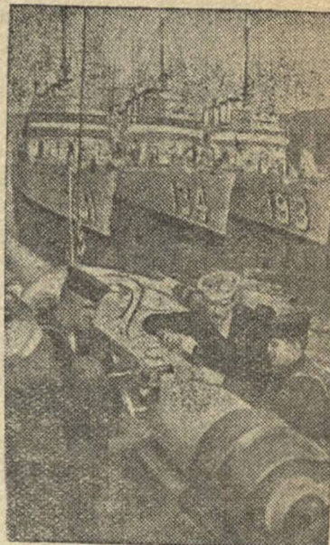
Американские эсминцы, переданные Англии, в одном из английских портов.