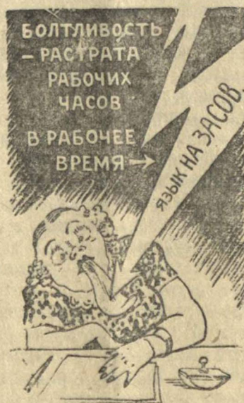
Рис. В. Баркова и В. Лисевича.

Как нельзя подходит в данном случае изречение Владимира Маяковского: „Болтливость — растрата рабочих часов. В рабочее время язык на засов“. Не мешало бы работникам конторы уполнаркомзага почаще вспоминать эти слова великого поэта.