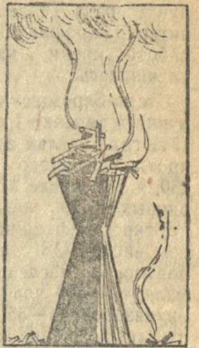
и их продукция.