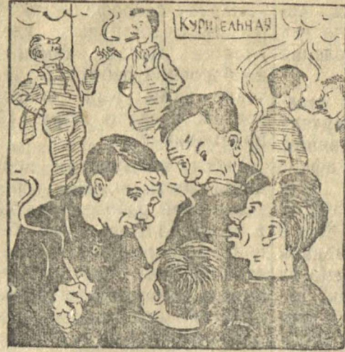
Болтуны Рисунок Б. Анфилова.