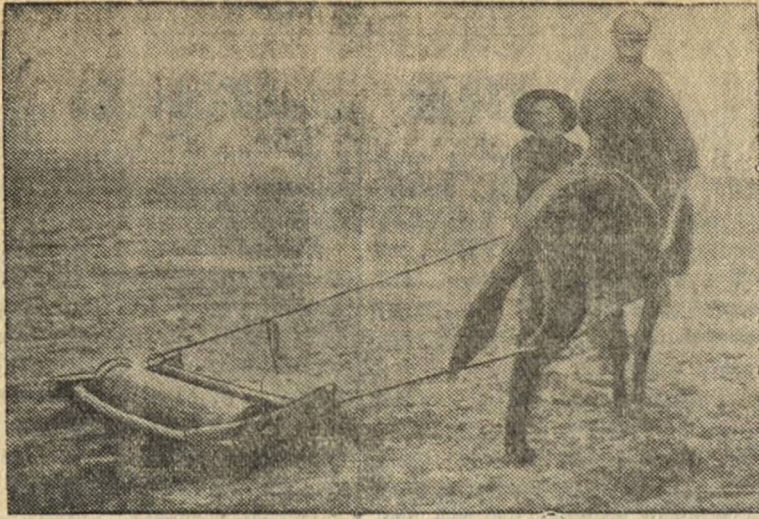
Манчжурский крестьянин на весенне-полевых работах.