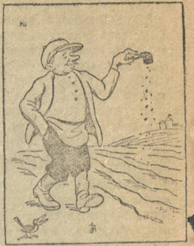
Золотой удобряем! Рисунок Ю. Узбякова.

В Ст.Березовке минеральных удобрений нет ни пылинки (не заготовлено).