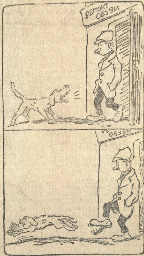
Рис. Ю. Узбякова.