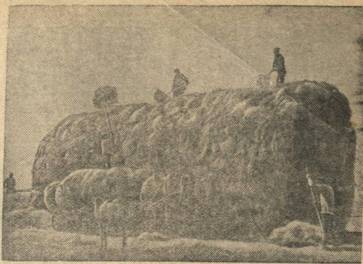
Скирдование сена в 4-й ферме овцесовхоза № 8 „Приволжский“ (Красноармейский район, Сталинградская область).

(Передовая „Горьковской коммуны“ за 13 июня).