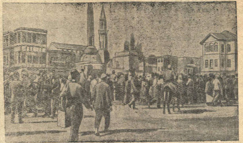
Площадь в Дамаске (столица Сирии).