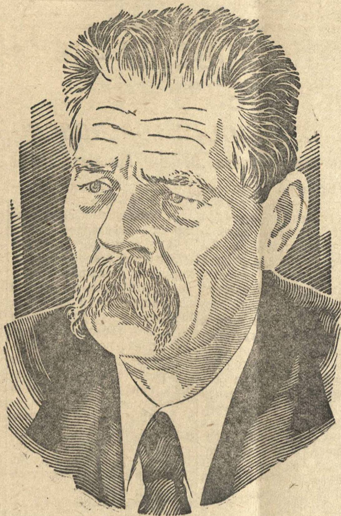
Алексей Максимович Горький

До Горького тоже были писатели, отразившие в своих произведениях ненависть трудящихся масс к туеядцам, к эксплуататорским классам. Горький