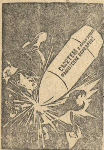
Рисунки художника Н. Долгорукова. (Репродукция с плаката, выпущенного издательством «Искусство»).