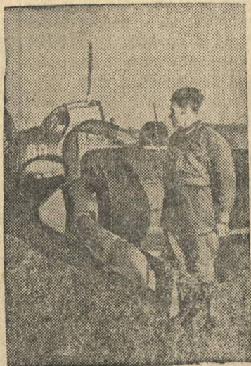
Сбитый нашими доблестными летчиками фашистский бомбардировщик.