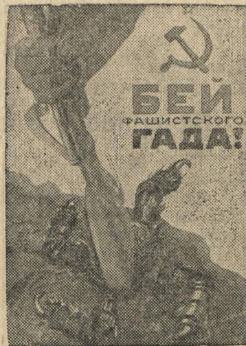
Рисунок художника Кокорекина. (Репродукция с плаката, выпущенного издательством «Искусство»).