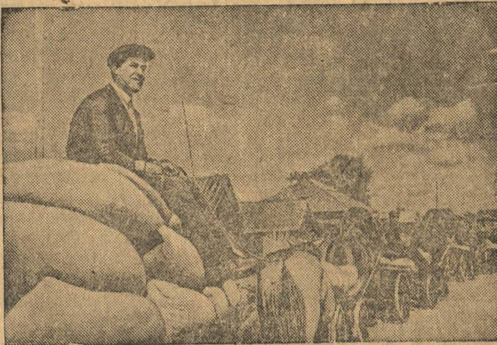
Красный обоз колхоза „Красный Урал“. За один день колхоз сдал 104 центнера высококачественного зерна.