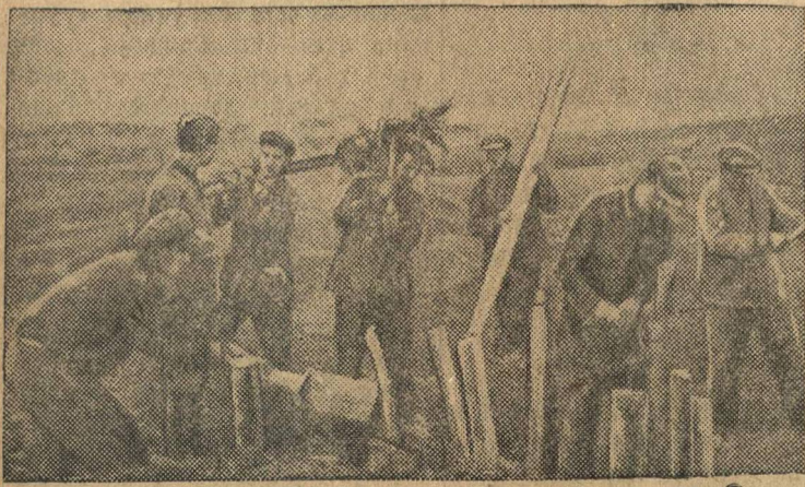
Колхозники строят противотанковые препятствия

Население прифронтовой полосы самоотверженно помогает бойцам Красной Армии в борьбе против фашистских захватчиков.