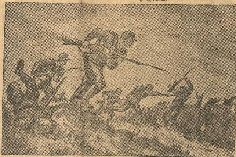
Грозна атака штыковой! Бегут фашистские войска! Врагов привычка вековая—Бежать от русского штыка!

Все здания Толбинской средней школы отремонтированы. В классах переложено заново 13 печей и 16 печей отремонтировано. Во всех классах побелены потол-