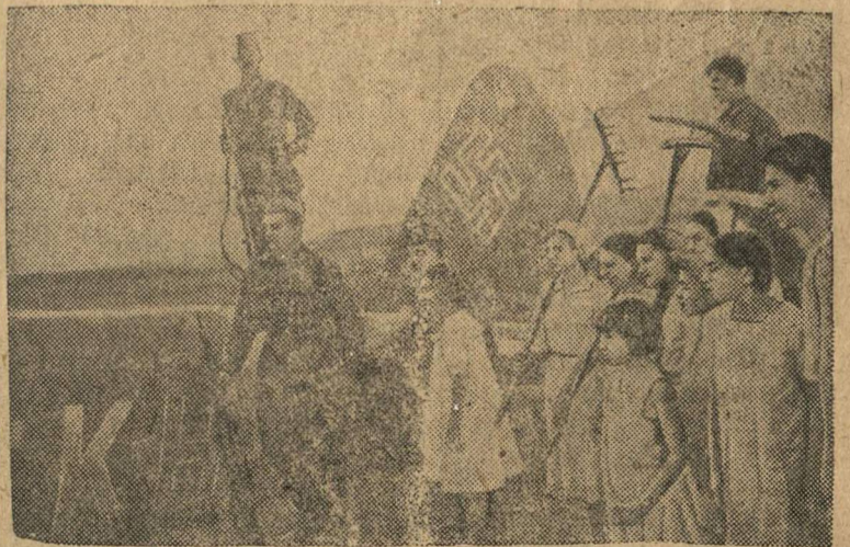
Фашистский самолет, сбитый отважными советскими летчиками.