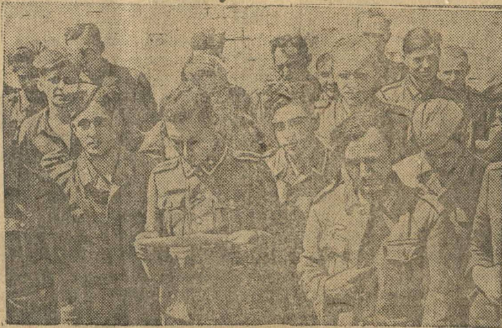
Группа пленных немцев.