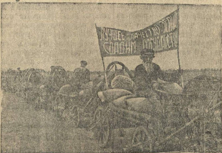
Красный обоз колхоза „Победитель“ (Воротынский район, Горьковской области) везет хлеб нового урожая на приемный пункт „Заготзерно“.