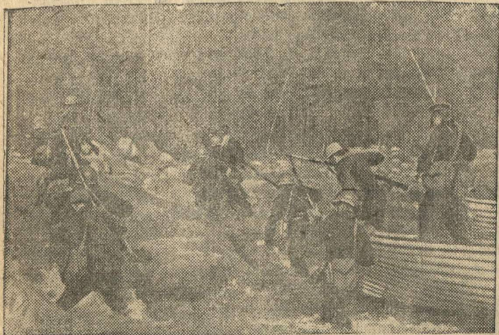
Действующий Краснознаменный Балтийский Флот.

Наше авиасоединение, действующее на Западном фронте, за 28 октября уничтожило около 50 немецких танков, 210 автомашин с боеприпасами, рассеяло и частично уничтожило до полутора полков вражеской пехоты.