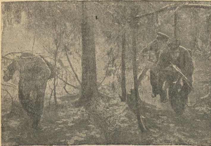
Действующий Краснознаменный Балтийский Флот.

Десант балтийцев, высадившись на вражеском острове, «прочесывает» лес.