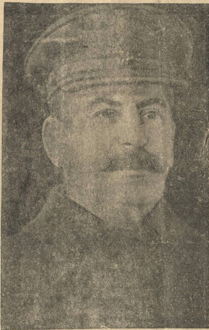
И. В. СТАЛИН (Ноябрь 1941 г.)

Ленин и Сталин еще на заре строительства советского государства предвидели надвигающуюся опасность военного нападения против первой в мире страны социализма и готовили наш народ к великой борьбе и победам. Они учили, что без создания крупной материальной базы социализма—тяжелой промышленности—мы не сможем отстоять завоевания Советской власти, защитить нашу родину.