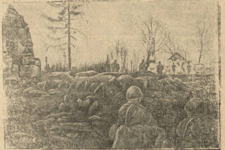
Действующая Армия, (Западный фронт).

На снимке: Бойцы атакуют населенный пункт М.