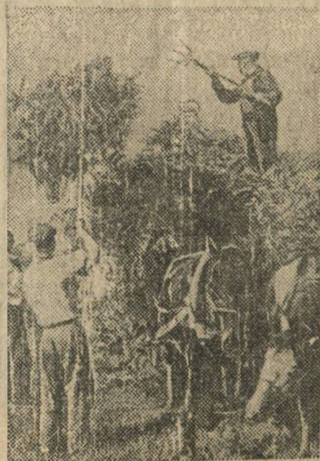
Уборка клевера на участке Чимкентского голодового питомника.

С 25 июля 1942 г. Народный Комиссариат финансов СССР, по постановлению Правительства Союза ССР, проводит Вторую денежно-вещевую лотерею.