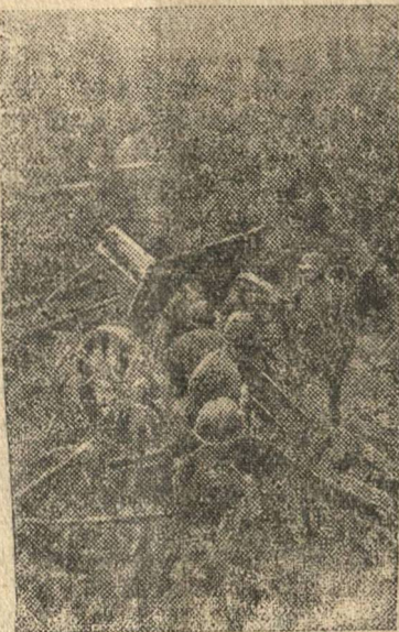
Гвардейцы артиллеристы ведут огонь по фашистам в районе города Н.