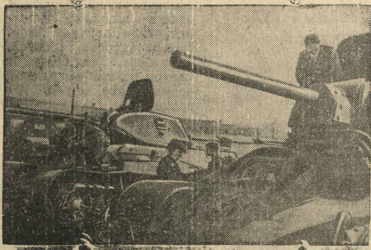
Последняя проверка танков на Н-ском танковом заводе перед отправкой на фронт.