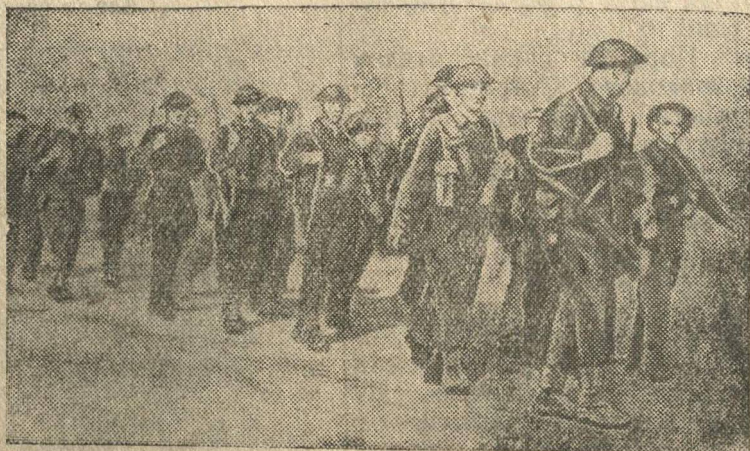
На снимке: Солдаты английского военно-воздушного полка продвигаются в Мэзон-бланш (Алжир) для занятия аэродрома.