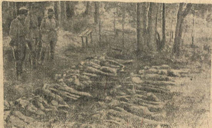
В деревне Пешково, Орловской области, фашистские мерзавцы расстреляли до 200 мирных советских жителей — женщин, стариков и детей.

На снимке: Трупы расстрелянных.