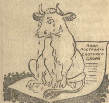
Единственная жилищная площадь.