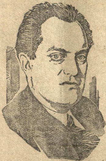
В. В. Куйбышев.

В одной из анкет, заполненной Куйбышевым в период граждан-