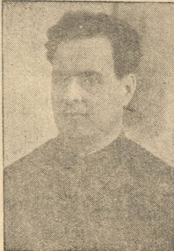
МОДЕСТ ТИХОНОВИЧ ТРЕТЬЯКОВ,

секретарь Горьковского обкома и Горькома ВКП(б), избранный депутатом Совета Союза Верховного Совета СССР по Горьковскому-Ленинскому избирательному округу № 116.