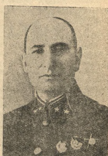
СТЕПАН ИЛЛАРИОНОВИЧ ЕРЕМИН,

начальник управления ИБВД по Горьковской области, избранный депутатом Совета Союза Верховного Совета СССР по Семеновскому избирательному округу № 128.