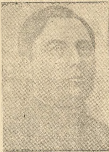
Кандидат в члены Политбюро ЦК ВКП(б) Г. М. Маленков.