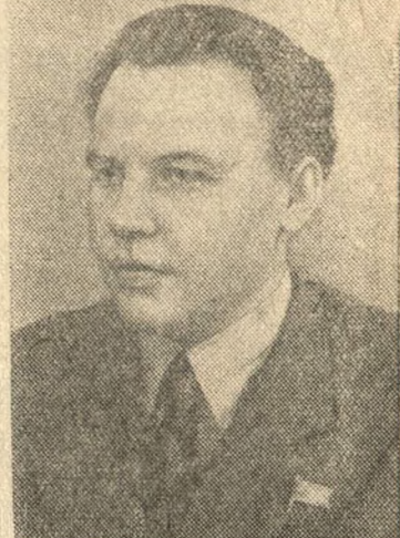
Кандидат в члены Политбюро ЦК ВКП(б), Первый Заместитель Председателя Совета Народных Комиссаров Союза ССР по экономсовету Н. А. Вознесенский.