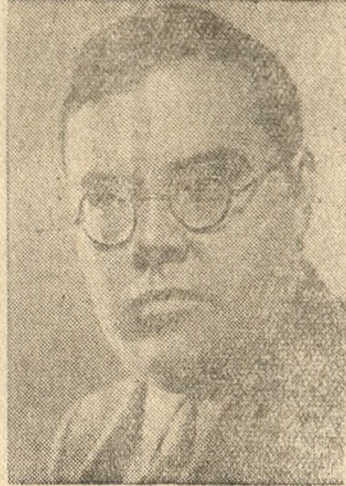
Кандидат в члены Политбюро ЦК ВКП(б) А. С. Цербаков.