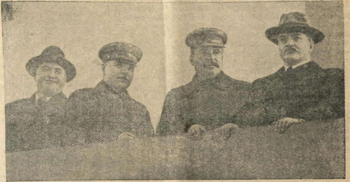
Справа налево: товарищи В. М. Молотов, П. В. Сталин, К. Е. Ворошилов и Г. М. Димитров на трибуне мавзолея.