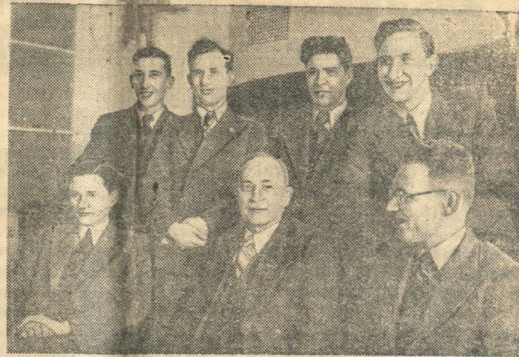
Тов. Куусинен среди участников турнира (слева направо): в первом ряду — П. Берес, О. Куусинен, М. Ботвинник; во втором ряду — П. Вондаревский, Н. Болеславский, А. Лиленталь и В. Смышлов.

6-го апреля шахматный турнир в Ленинграде посетил Заместитель Председателя Президиума Верховного Совета СССР и Председатель Президиума Верховного Совета Карело-Финской ССР товарищ (I). Куусинен.