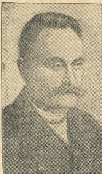
Н. Я. Франко.

28 мая исполняется 25 лет со дня смерти выдающегося украинского писателя и ученого Н. Я. Франко.