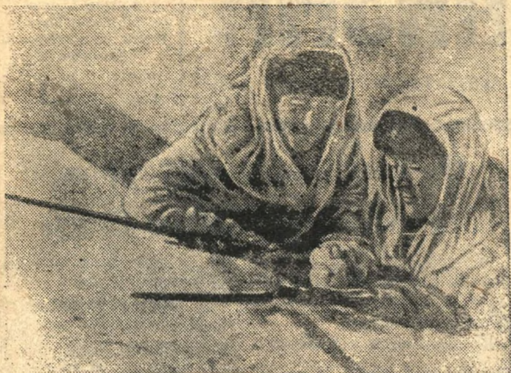
Письмо в родной колхоз.