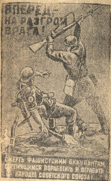
Плакат работы художника Д. Шаринова, выпущенный издательством «Искусство»

Руководители колхозов сейчас обязаны принять все меры к тому, чтобы собрать и отправить весь имеющийся в колхозе и у колхозников металлический лом, так как он нужен для оборонной промышленности, для фронта, для разгрома фашизма. Н. Беспалов — управляющий заготконторой РПС.