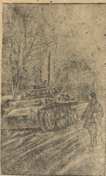
На снимке: Немецкие боевые машины на дороге близ Бородино.