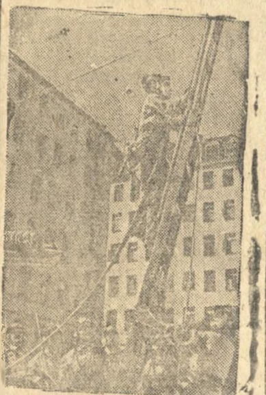
Позиция пожарники одной из участковых пожарных команд Ленинского р-на (Ленинград) на тренировке.

Плохо работают Валювенка и целый ряд других первичных комсомольских организаций.