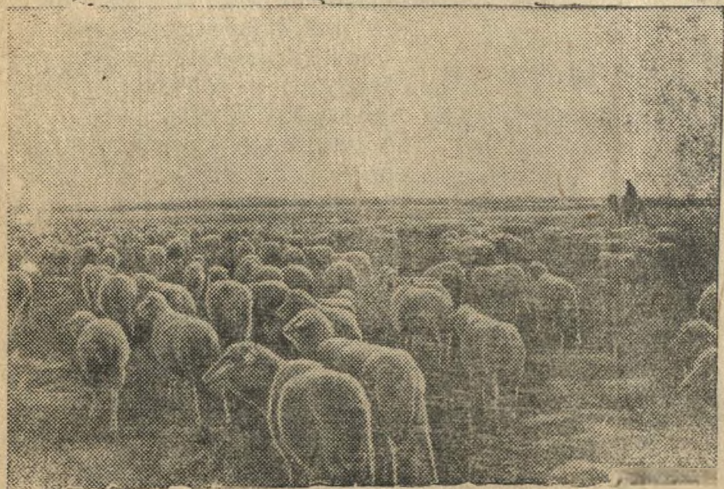
На снимке: Перегон отар овец колхоза имени Молотова (Чуйский район, Фрунзенская область).

В текущем году в отгонном животноводстве на летних пастбищах Киргизии будет находиться свыше 2-х миллионов голов скота и на зимних пастбищах около миллиона.