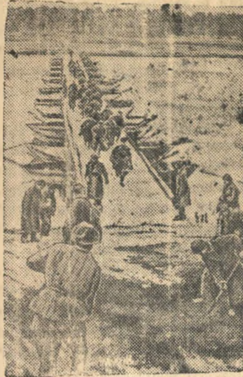
Поклонный мост через реку Н.