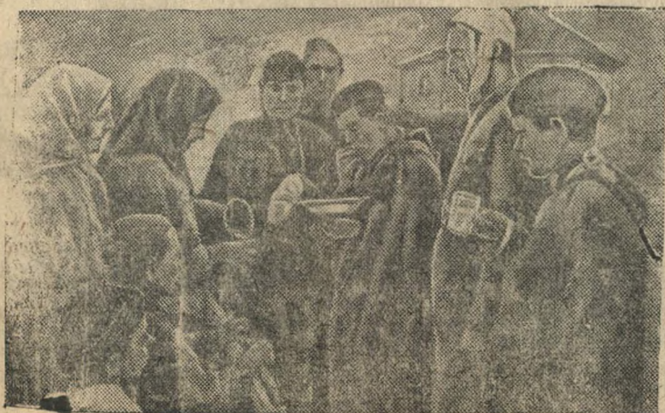
На снимке: Колхозницы угощают раненых бойцов.

На улицах освобожденной станицы. (район Дона).