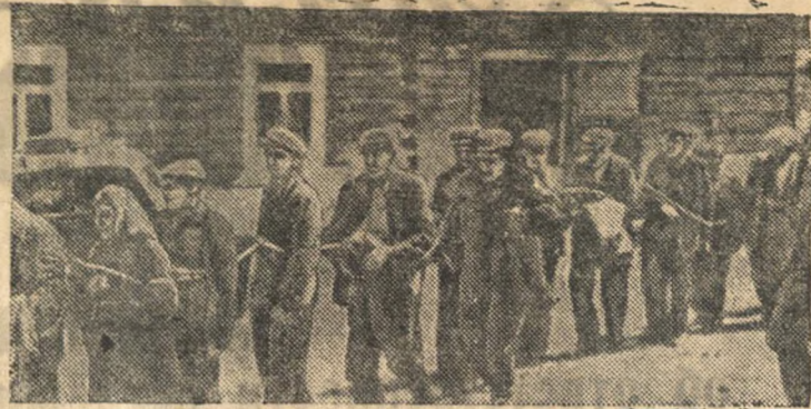
Ни в чем неповинных мирных советских людей немецкие пзверги связывают веревками и гонят, как скот, на убой. (Снимок найден у убитого немецкого солдата).