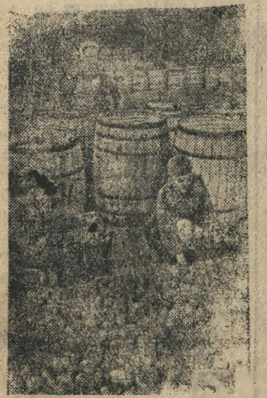
На снимке: Заседка помидоров, огурцов, баклажов и других овощей для общественного питания.

Эвакуированный в глубокий тыл Н-ский завод за год пребывания на новом месте сумел создать хорошее подсобное хозяйство, которое сейчас занимает одно из первых мест в области.