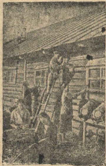
На снимке: Животноводческая бригада колхоза имени 8 марта (Кохомский район, Ивановская область) занимается ремонтом скотного двора.