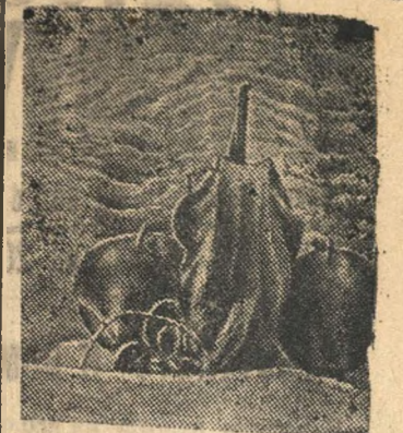
На снимке: катера в боевом походе.