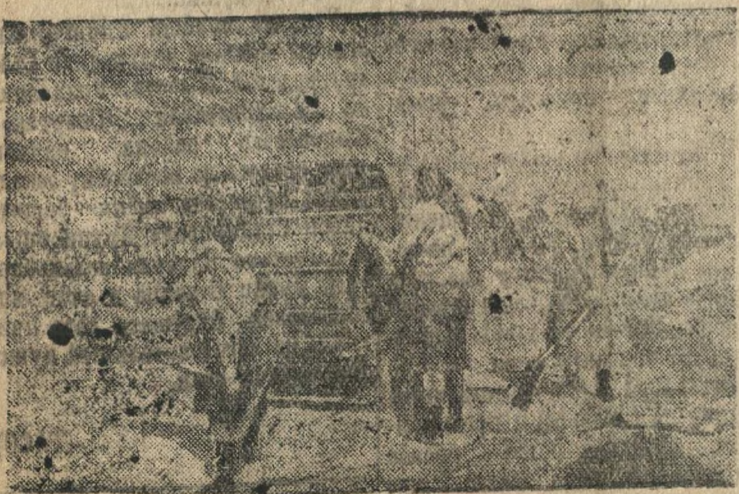
На снимке: На току колхоза. Подготовка хлеба к сдаче государству.